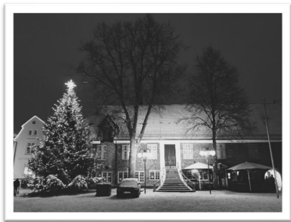
Abb. 12: Rathausmarkt 2021