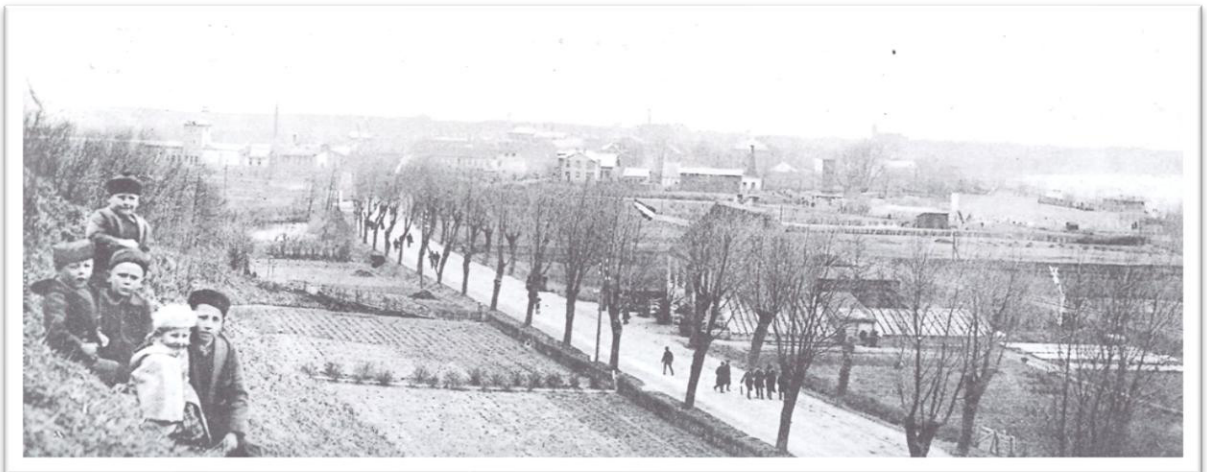
Abb. 2: Kieler Landstraße stadteinwärts, rechts Gärtnerei Thede