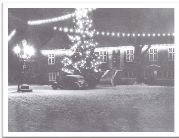
Abb. 11: Rathausmarkt 1950