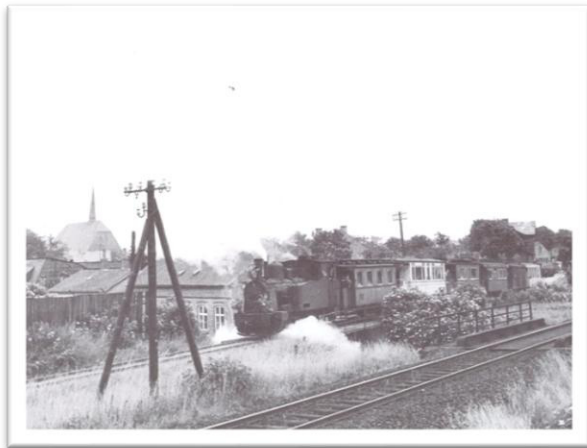
Abb. 4: Kreisbahn in Fahrt Richtung Kappeln

In dieser Jahreszeit wurde es schon früh dunkel und die Mutter kam und kam nicht zurück. Die beiden Mädchen verfielen in Panik und malten sich schon aus, dass sie nun Vollwaisen seien! Doch die Mutter kam natürlich zurück, mit einem Sack Äpfeln im Schlepptau.