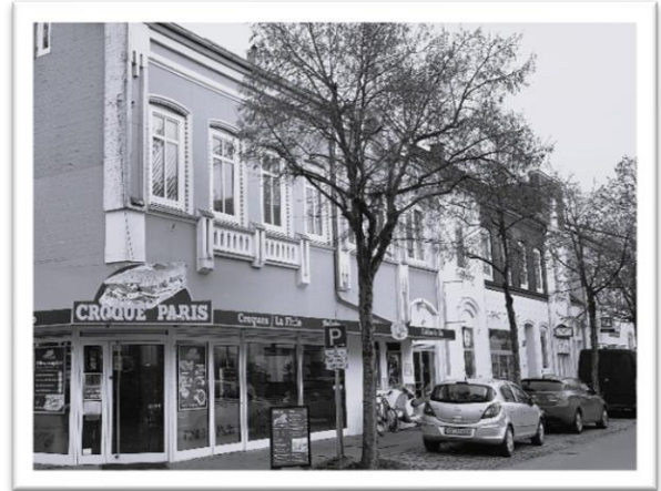
Abb. 8: Kieler Straße 61, 2024