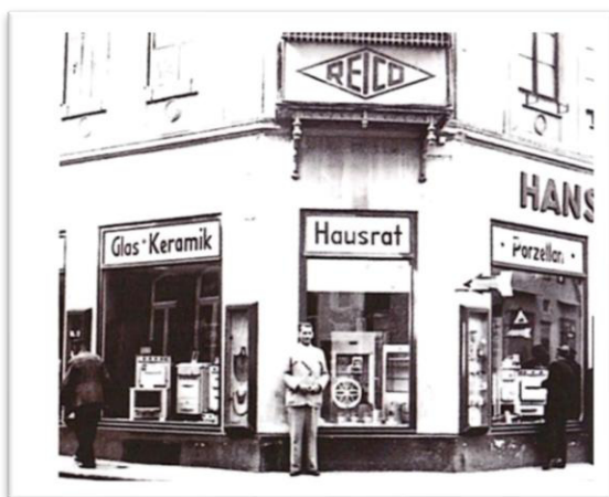
Abb. 9: Kaufhaus Reico, Langebrückstraße 9