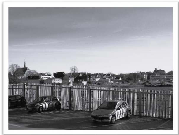
Abb. 5: Ähnliche Blickrichtung 2024

Am Heiligen Abend konnte Helga dann eine Babypuppe mit einer Bubikopf-Frisur auspacken. Elkes Babypuppe hatte zwar die gewünschten Zöpfe, aber die Puppe war eine Gelenkpuppe! Egal wie man sie hinsetzte oder hinlegte, irgendein Gelenk bewegte sich immer in die falsche Richtung. Naja!