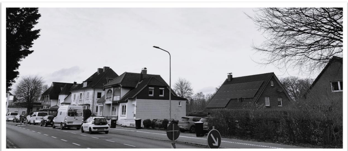
Abb. 3: Ähnliche Blickrichtung 2024