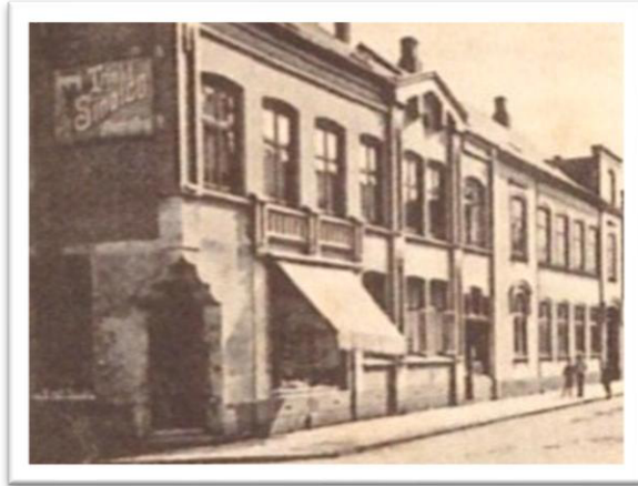
Abb. 7: Schlachterei Böhde, Kieler Straße 61