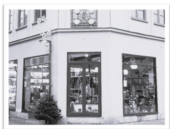
Abb. 10: Langebrückstraße 9, 2024

Ein Wunsch der Schwestern sei hier noch einmal gesondert erwähnt. Es muss 1949 oder 1950 gewesen sein. Wieder hatten die Mädchen denselben Weihnachtswunsch: Schlittschuhe! Natürlich nicht solche, wie man sie heute kennt, sondern damals waren es lediglich Kufen, die man sich unter die Schuhe schnallen konnte. Die Mutter machte den