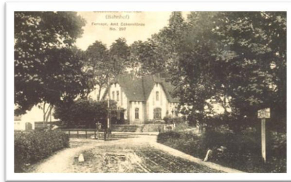
Abbildung 3: Bahnhof Altenhof

Für das Sammeln von Bucheckern gab es zwar kein Geld, diese konnten jedoch gegen Lebensmittel getauscht werden. Die Kinder fuhren daher wieder mit der Eisenbahn zum Bahnhof Altenhof. Die Buchen standen linker Hand Richtung Schloss, nicht weit vom Bahnhof entfernt.