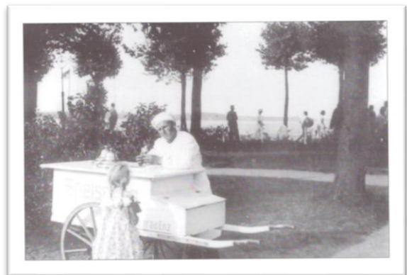
Abbildung 2: Eismann mit Eiskarren an der Promenade