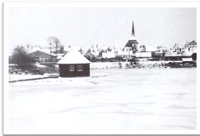
Abbildung 5: Zugefrorene Norderhake

Ob es Ärger gab? Elke wusste es nicht mehr so genau. Natürlich hat ihre Mutter die Hose geflickt und auch die Wunde ist wieder verheilt. Die zurückgebliebene Narbe erinnert Elke aber bis heute daran.