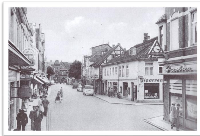
Abbildung 7: Buchhandlung Margarethe Winterberg, Kieler Straße

Gern erinnert sich Elke auch daran, dass sie und Frauke Fräulein Winterberg die Taschen nach Hause getragen haben. Diese betrieb einen Buchladen in der Kieler Straße 28 (heute Zeitungs- und Tabakladen). Die Mädchen warteten bis zum Feierabend und begleiteten Fräulein Winterberg dann bis zum Bahnübergang in Richtung Kiel am damaligen „Hotel Seegarten“, dem heutigen Hotel „BeachSide“. In dem großen Backsteinbau auf der anderen Straßenseite wohnte Fräulein Winterberg. Für die Hilfsbereitschaft gabs dann 20 Pfennig.