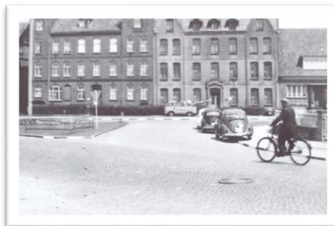
Abbildung 1: Frühere Kieler Landstraße