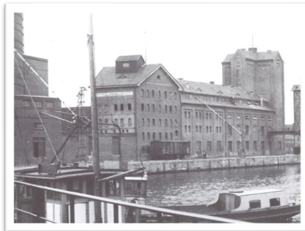
Abbildung 4: Getreidehandel am Hafen